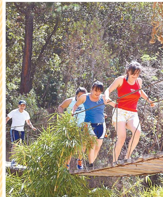
Momento para desestresarse.

PARQUE ECOLÓGICO ES UN PULMÓN DE SAN MARTÍN JILOTEPEQUE QUE ESPERA A MILES DE VACIONISTAS