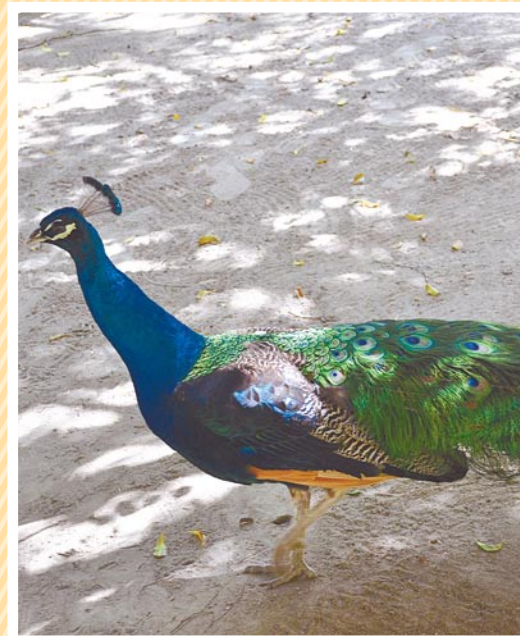
Salen al encuentro de los visitantes.